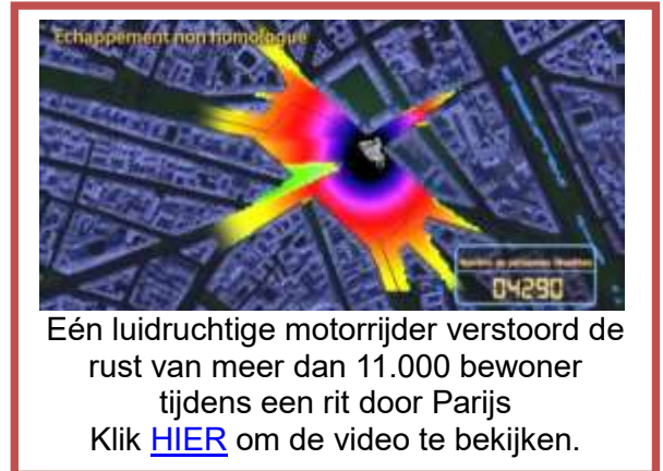
Eén luidruchtige motorrijder verstoort de rust van meer dan 11.000 bewoner tijdens een rit door Parijs Klik HIER om de video te bekijken.